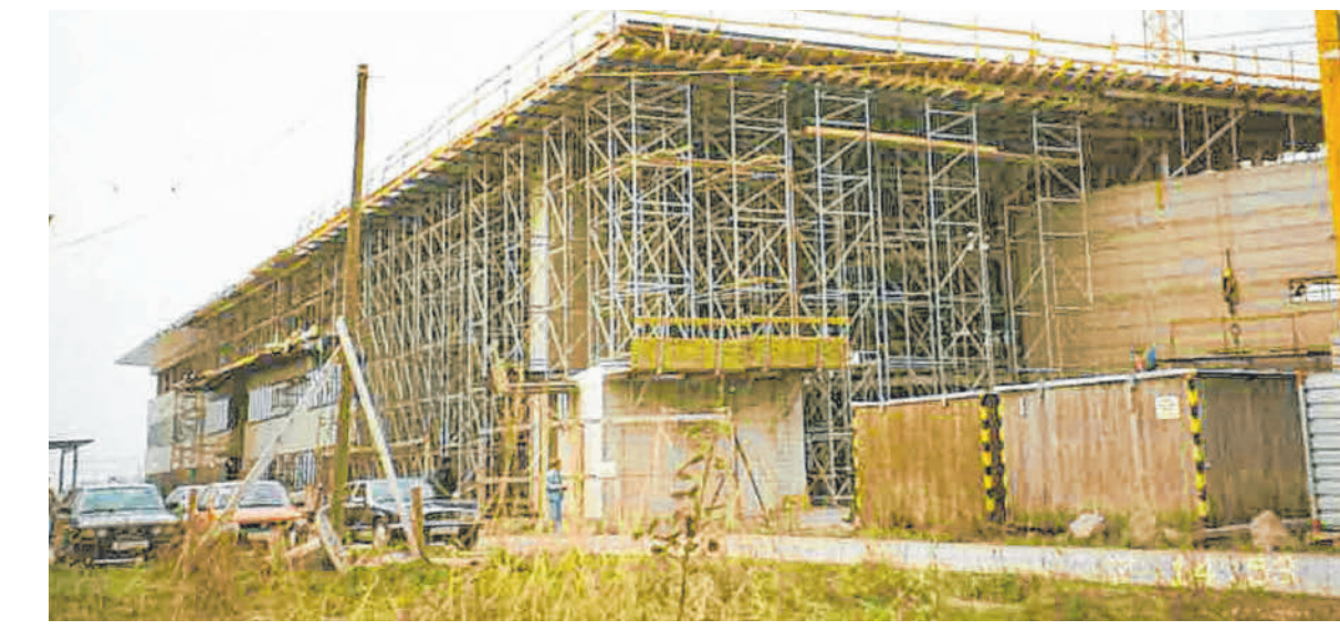
Das Vorarlberger Medienhaus im Bau.